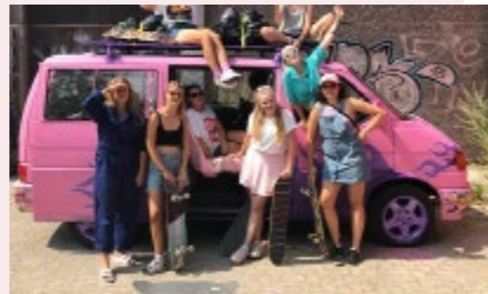
Don't give a fox